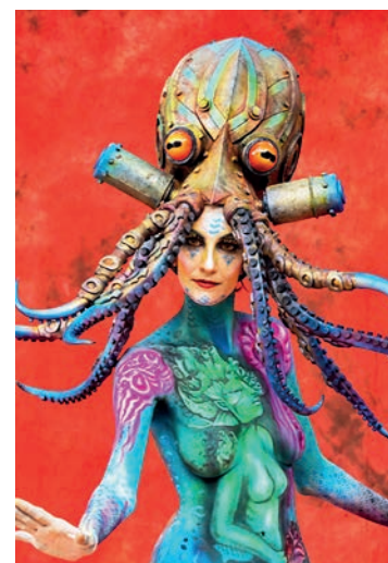
Einzigartige Körperkunst beim World Bodypainting Festival.