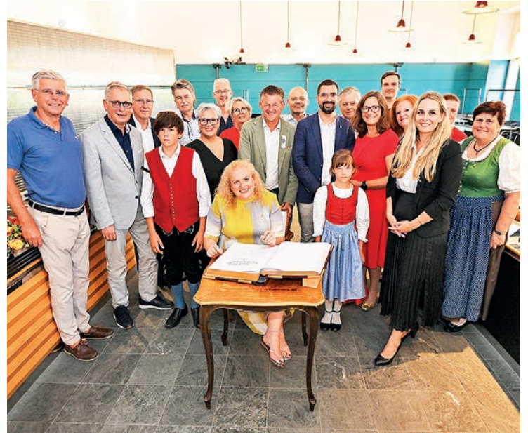
Freundschaftliche Jubiläumsfeier mit den Gästen aus Tarragona im Klagenfurter Rathaus.