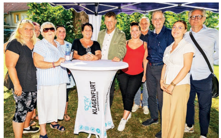
Im Park der Dr.-Robert-Koch-Gasse sprachen die Anwohner im Rahmen der „Hofgespräche“ in gemütlicher Atmosphäre mit Politik und Stadtverwaltung über ihre Anliegen.