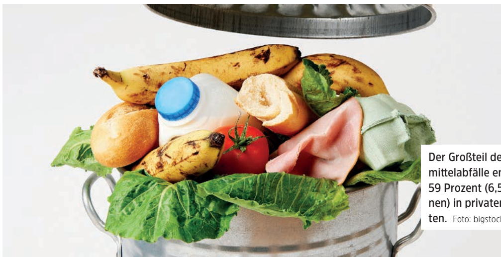
Der Großteil der Lebensmittelabfälle entsteht mit 59 Prozent (6,5 Mio. Tonnen) in privaten Haushalten.

Gärten sind gerade in Städten wertvolle Lebensräume für zahlreiche Tiere. Abgesehen von unnötigem Energieverbrauch, fallen in Österreich jährlich Millionen von Nachtfaltern oder Glühwürmchen künstlichen Lichtquellen zum Opfer. Viele weitere nachtaktive Tiere werden von Lichtquellen irritiert. Auch tagaktive Tiere leiden durch die hellen Nächte, weil ihr Schlaf gestört wird. Schalten Sie alle Lichtquellen aus, die nicht der Sicherheit dienen. Reduzieren Sie die Lichtdauer durch Bewegungsmelder oder Zeitschaltuhren. Das spart auch Energie und Geld! Verwenden Sie Leuchten, die nur nach unten strahlen und nach oben und an den Seiten abgeschirmt sind. Montieren Sie sie möglichst niedrig, um eine starke Lichtstreuung zu vermeiden. Verwenden Sie energiesparende, langlebige LED-Lampen mit dem Farbton „warmweiß“. Ihr Licht enthält keine UV-Anteile und ist dadurch insektenfreundlicher. Verzichteten Sie auf die Beleuchtung von Wänden, Objekten und Bäumen. Bei Leuchten darauf achten, dass die LEDs ausgetauscht werden können und nicht die ganze Lampe entsorgt werden muss.