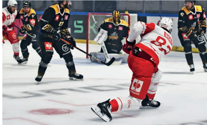
Gut gestartet ist der KAC in die Champions Hockey League mit einem Sieg gegen Frankreichs Meister Rouen.

Eiszeit. Im höchsten Europapokal-Wettbewerb im Eishockey steht der EC KAC vor zwei Heimspielen. In die Liga starten die Rotjacken gegen Salzburg.