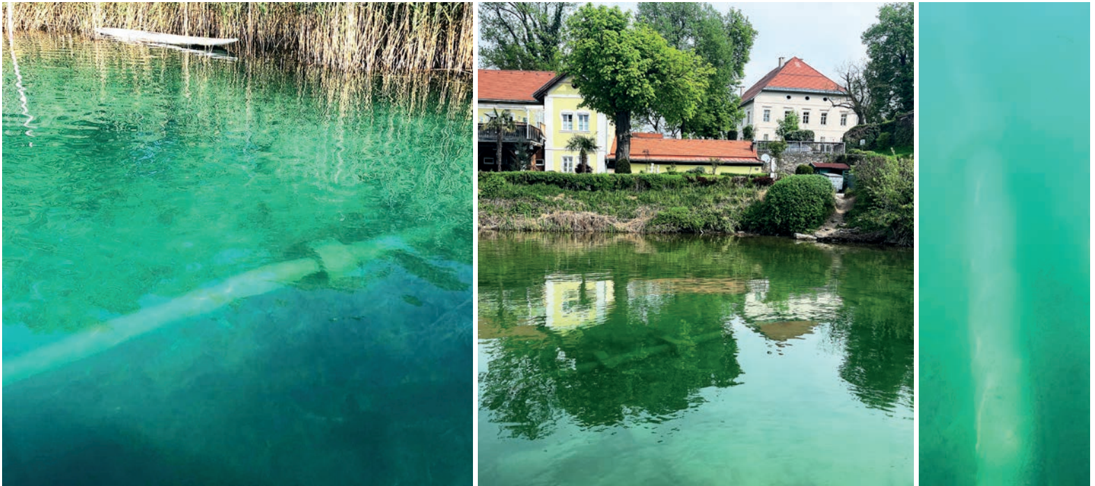
So sehen die Leitungen unter Wasser aus. Sie werden bald ersetzt.