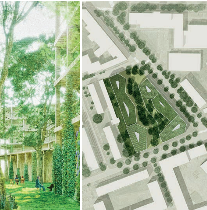
In der Stadtentwicklung setzt Klagenfurt auf Entsiegelung und mehr Grünräume. Das zeigt auch das kommende Wohnbauprojekt „Green Canyon“ am Gelände des alten Hallenbades. Visualisierungen: pentaplan ZT-GmbH