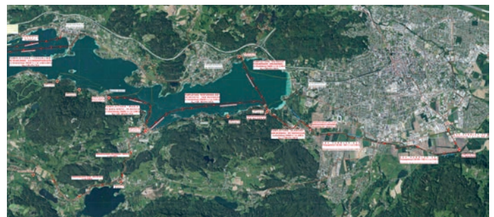
Die neuen Seedruckleitungen (rot) sind über das gesamte östliche Gebiet des Wörthersees verteilt. Grafik: WWO

Wenn die Baumaschinen in den kommenden Monaten anrollen, wird dies der Beginn einer mehrjährigen Transformation sein. Doch die Geduld und das Engagement, die von den Beteiligten abverlangt werden, lohnen sich. Am Ende dieses Projekts wird die Region nicht nur ein hochmodernes Ableitungssystem haben, sondern auch die Sicherheit und Lebensqualität für die Bevölkerung garantieren.