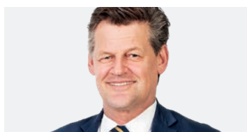
Bürgermeister Christian Scheider

Stadtentwicklung. In Klagenfurt gelten strenge Auflagen gegen Verbauung und Versiegelung. 2023 wurden nur für zwei Hektar Land Widmungsverfahren gestartet. Für Parkplätze sind Begrü-mungsmaßnahmen vorgeschrieben, und bei neuen Projekten werden Flächen wieder entsiegelt.