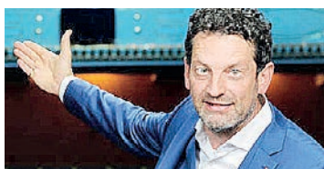
Aron Stiehl Intendant des Stadttheaters

„Für unser Publikum erschaffen wir jeden Abend eine neue Welt. Wir laden Sie ein zum Erleben, zum Zuhören, zum Teilen, zum Nachdenken, zum Staunen.“