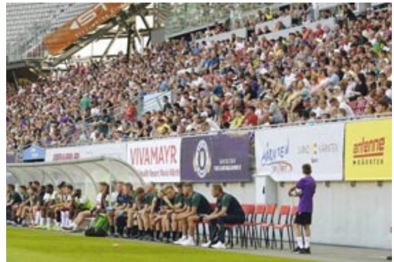
Zum „Vereinstag“ am 13. August lädt Austria Klagenfurt alle Kärntner Sportklubs bei kostenlosem Eintritt in die 28 Black Arena nach Waidmannsdorf ein.

Die Einladung zum Vereinstag gilt aber nicht nur für Fußballer. Willkommen sind alle Menschen, die in den 1.600 Kärntner Vereinen in über 60 Sportarten aktiv sind – von Eishockey über