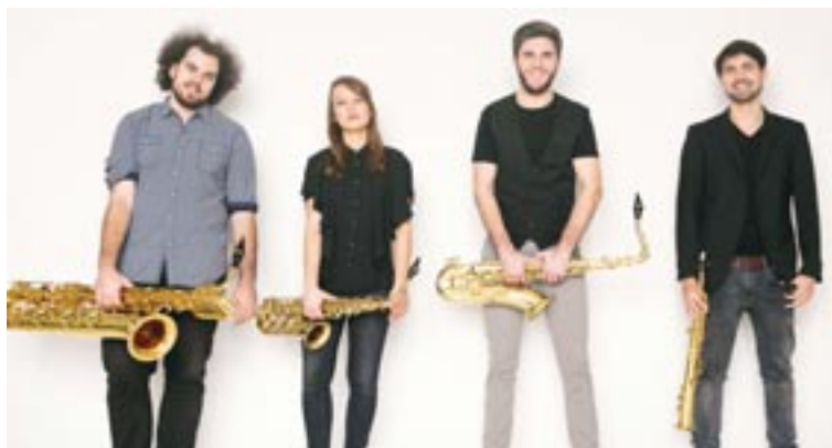
Arcis Saxophon Quartett – am 13.8. im Burghof.