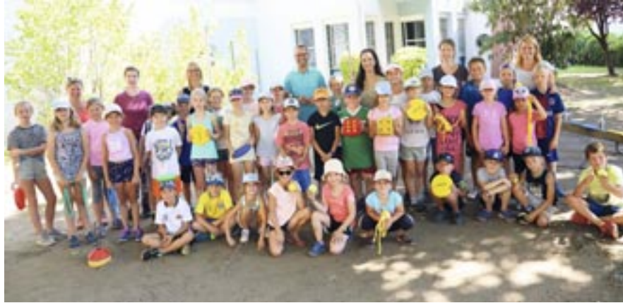
Die Kinder im Hort Waidmannsdorf 1 hatten viel Spaß beim Bewegungsworkshop mit der Sportunion.