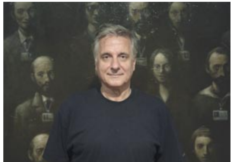
Die Stadtgalerie Klagenfurt präsentiert erstmals in Österreich die beeindruckenden Werke von Goran Djurović.

Eine tiefe Liebe zur Malerei und scharfe Beobachtungsgabe sind in der Kunst Goran Djurovićs eng miteinander verknüpft. In seiner Malweise, die geprägt ist durch Lichtregie, dicken mehrschichtigen Farbauftrag, Hell-Dunkel-Kontrast und gedeckte Farbigkeit, schöpft Goran Djurović aus den Tiefen der Kunstgeschichte und greift auf die alten Meister wie Rembrandt oder Goya zurück: „Bei beiden beeindruckt mich besonders ihre Peinture, mit der sie so wunderbar Geist und Seele umsetzen“, so der 1952 in Belgrad geborene Künstler. Die Ausstellung ist noch bis 11. September zu sehen.