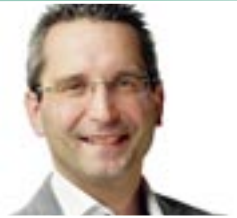
Stadtrat Mag. Franz Petritz Sport- und Gesundheitsreferent

Trotz der heißen Temperaturen hatten die Kinder des Hort Waidmannsdorf 1 gemeinsam mit den Trainern der Sportunion einen tollen Tag. Neben einem Parcourslauf, bei dem die Motorik der Kinder geschult wurde, gab es auch Übungen für die Koordinationsfähigkeit. Für eine kleine Abkühlung sorgte die Balanceübung, bei der die Kinder versuchten, einen Wasserbecher auf der Schildkappe zu tragen. Dazu brauchte es schon einiges an Geschicklichkeit und Konzentration der jungen Sportlerinnen und Sportler. JG