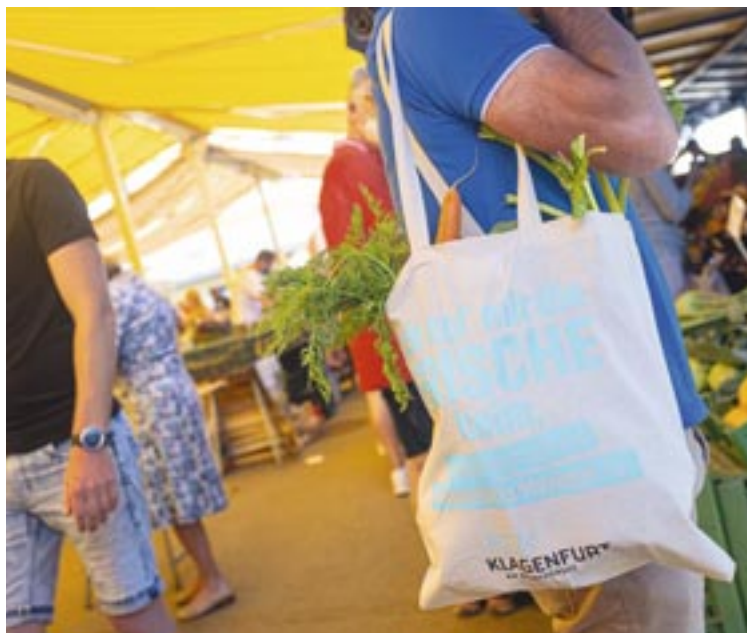
Frisch und regional: Auf Klagenfurts Märkten wird gerne eingekauft! Zur Weiterentwicklung wurde vor Kurzem eine Kundenbefragung gestartet.