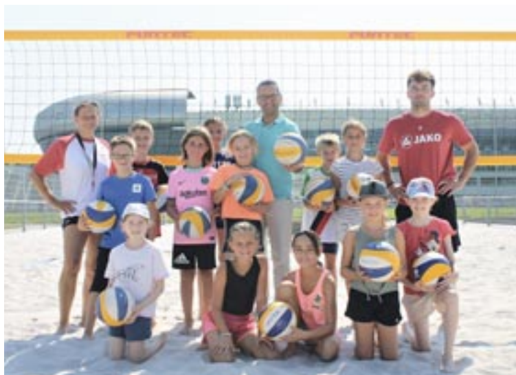
Volleyball stand ebenfalls auf dem Programm des Sommersportschnupperns, zu dem auch Sportreferent Stadtrat Mag. Franz Petritz vorbei schaute.