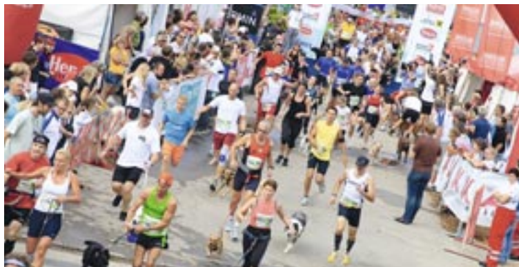
Kärnten Lläuft kehrt mit der Running City an den Metnitzstrand zurück.

Die 4,3 km können sowohl einzeln als auch im 3er-Team bewältigt werden. Es soll dabei aber vor allem der Spaß im Vordergrund stehen. Mit etwas Glück wird das kreativste Laufkostüm zum besten Outfit gekürt. Nach dem Lauf findet direkt in der Running City die Eröffnungsfeier, Runners Party und ein ko-