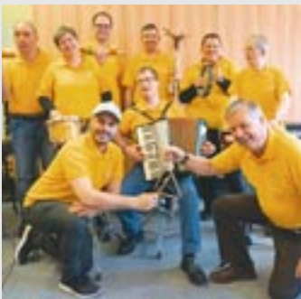
Musica Kontakt.

Sitzplatzreservierungen für beide Events unter 0699 / 191 44 180 oder office@eboardmuseum.com Infos auf www.eboardmuseum.at