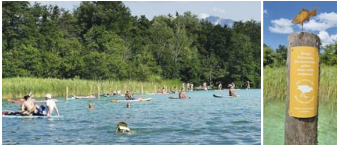
An Spitzentagen tummeln sich bis zu 60 Wassersportler pro Stunde am Lendspitz. Abstandspiloten weisen auf die Grenze zum Natura 2000 Gebiet hin, was allerdings nicht immer wahrgenommen wird.

In Österreich werden rund 266.700 Tonnen Altglas pro Jahr gesammelt. Jede richtig entsorgte Glasverpackung wird dem Recycling übergeben, weil Altglas der wichtigste Rohstoff für die Glasproduktion ist. Zum Altglas zählen: Flaschen (Wein- und Saftflaschen, Flaschen für Essig, Öl etc.), Konservengläser (Gläser für Marmelade, Gurken, Pesto etc.), Parfümflakons, Medizinfläschchen, Einweg-Gewürzmühlen aus Glas und gläserne Flaschenverschlüsse. Ungefärbtes Verpackungsglas gehört zum Weißglas, gefärbtes zum Buntglas. Lebensmittelgläser müssen fürs Recycling nicht ausgewaschen werden. Auslöffeln und Austrinken reichen. Aus hygienischen Gründen kann es vor allem im Sommer sinnvoll sein, Lebensmittelgläser auszuspülen. Honiggläser sollten zum Schutz der Bienen ausgewaschen werden. Flachglas (Fensterglas, Windschutzscheiben etc.), Glasgeschirr (Trinkgläser, Vasen etc.), hitzebeständige Einmachgläser, Glühbirnen, Spiegel, Opalglas, Bildschirme, Halogen- und Energiesparlampen, Leuchtstoffröhren gehören zum Fachhandel oder zur Problemstoffsammelstelle. Eine Bitte im Sinne der Anwohnenden: Glas einwerfen nur zwischen 7 und 19 Uhr und nicht an Sonn- und Feiertagen!