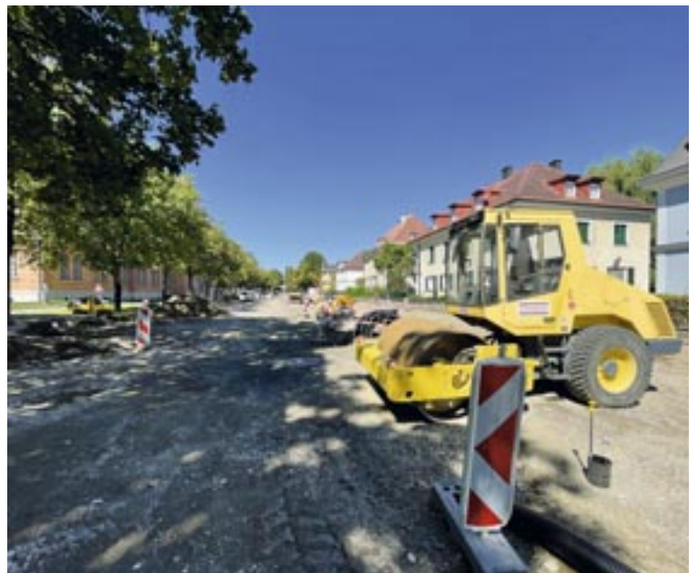
Noch bis Mitte November läuft die Neugestaltung des Straßenraums in der Jesserniggstraße. Es kommt dabei zu Sperren.

Im 2. Bauabschnitt, vom 22. August bis 12. November, wird die Jesserniggstraße im Bereich von der Enzenbergstraße bis zur Siriusstraße komplett gesperrt. Hier gilt dann ein beidseitiges Halte- und Parkverbot. Einmündende Seitenstraßen werden je nach Bauabschnitt in die jeweilige Fahrtrichtung abgeleitet. Der Fußgänger- und Radverkehr wird gesichert umgeleitet. Grundstücks- und Hauszufahrten bzw. Hauseingänge bleiben für Anrainer frei zugänglich. Der KMG-Busverkehr ist von dieser Baustelle nicht betroffen. RS