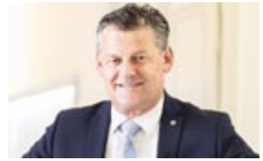
Bürgermeister Christian Scheider Sozialreferent

„Die Stadt bietet Bürgern, die vor allem jetzt aufgrund der massiven Teuerungen in finanzielle Notlage geraten sind, ein engmaschiges Netz mit unterschiedlichen Hilfsangeboten. Wir wollen die Menschen auf keinen Fall im Stich lassen!“