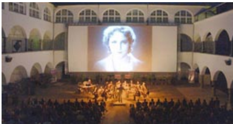
Gehört zum Sommer: Ein Abend im „Burghofkino“.