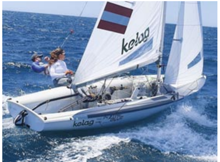
Donner und Slivon segelten in Portugal zu EM-Silber.

Auch privat läuft es für die Klagenfurterin 2022 ganz nach Plan. Noch vor der EM-Teilnahme in Portugal hat Rosa die Matura im SSL Klagenfurt erfolgreich bestanden. RS